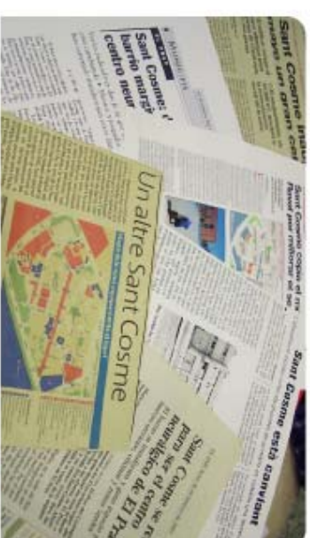
A l'Oficina trobareu un recull de premsa amb les notícies de Sant Cosme

ADIGSA, ha aprobado un nuevo paquete de ayudas complementarias para la instalación de ascensores. Estas nuevas ayudas se suman a las que ya ofrece conjuntamente con las del Ayuntamiento. Pasad por la Oficina Municipal y os informaremos con más detalle.