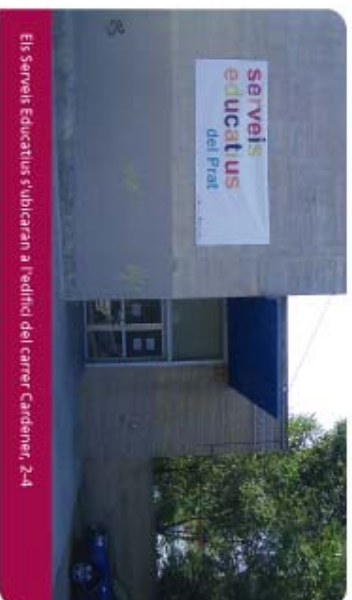
El Servei Educatius s'ubicaran a l'edifici del carrer Cardener, 2-4